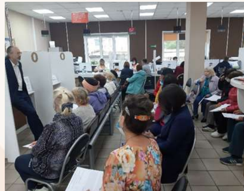
МФЦ рп. Усть-Абакан