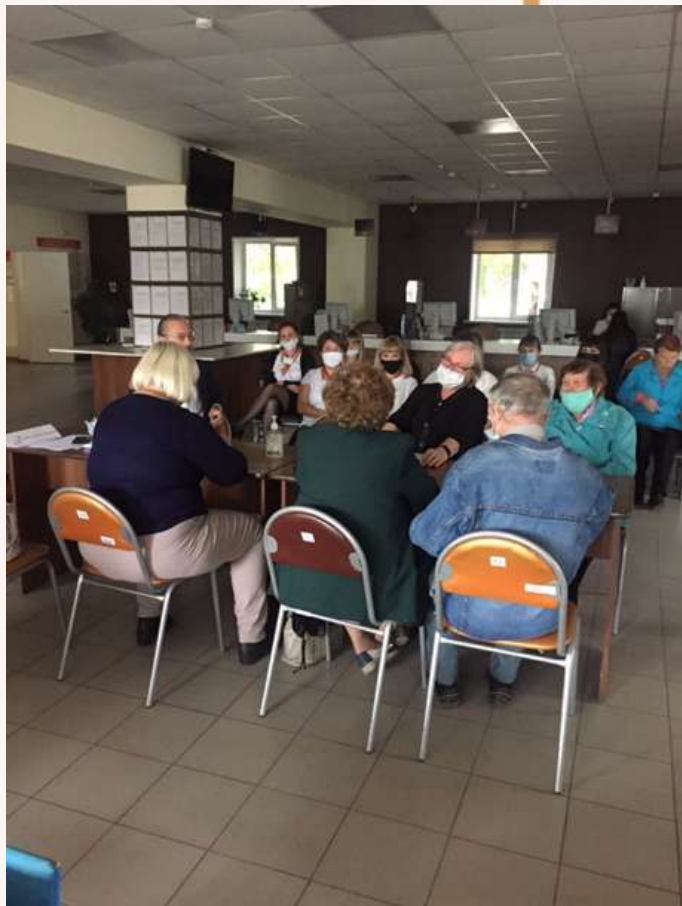
МФЦ г. Черногорск