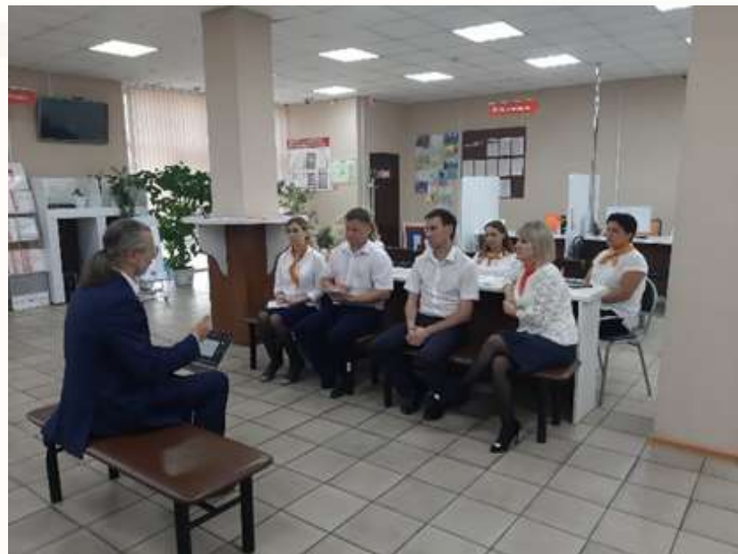
МФЦ рп. Усть-Абакан